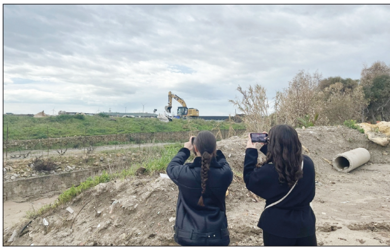
Il monitoraggio civico a cura degli studenti del liceo classico Pitagora

*Team Ribelli Kronici Liceo classico Pitagora di Crotona Intervista realizzata nell'ambito del progetto A scuola di OpenCoesione