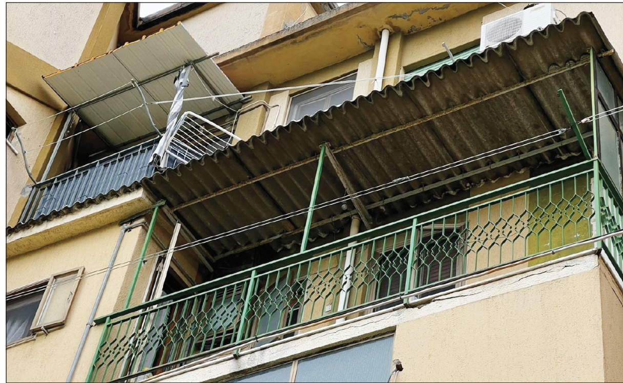
Lastre di eternit a Fondo Gesù

"Non preoccuparti di niente, perché ogni piccola cosa andrà bene". Eppure, fra palazzi abbandonati trasformati in discariche, balconi pericolanti e intonaci caduti l'impressione è ben altra. Più ci si addentra nel quartiere maggiore diventa la presenza di eternit sui tetti a ridosso del quale spesso si stende il bucato. Una bimba coi suoi vestiti coloratissimi esce di casa per andare all'asilo e sembra essere l'unica presenza di vita fra mura grigie prive di colore.