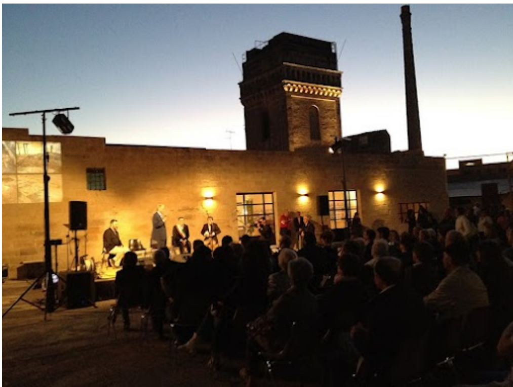
Foto dell'evento "Distillerie in scena" - Progetto teatrale nel parco urbano delle Distillerie De Giorgi

PATRIMONIO E RICCHEZZA CULTURALE PER SAN CESARIO DI LECCE: COSA SI DICE?