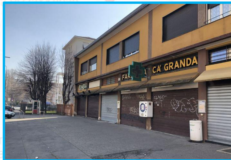
Palazzina su Via de Angelis