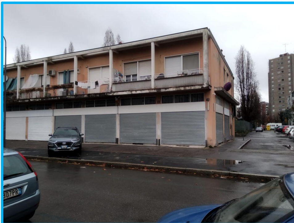
Il cantiere finito