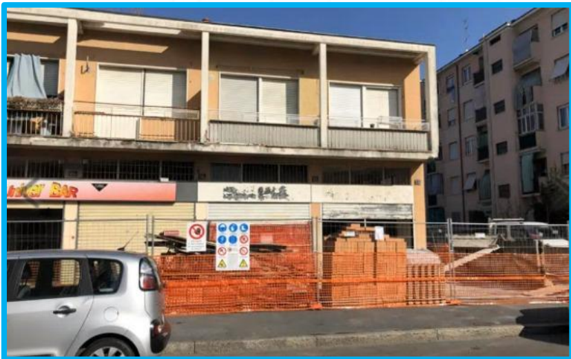
Il cantiere per la realizzazione dell'emporio