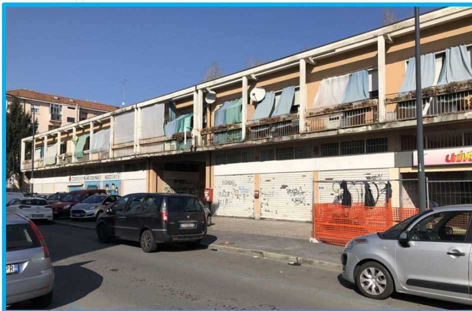
Palazzina su Viale Monti