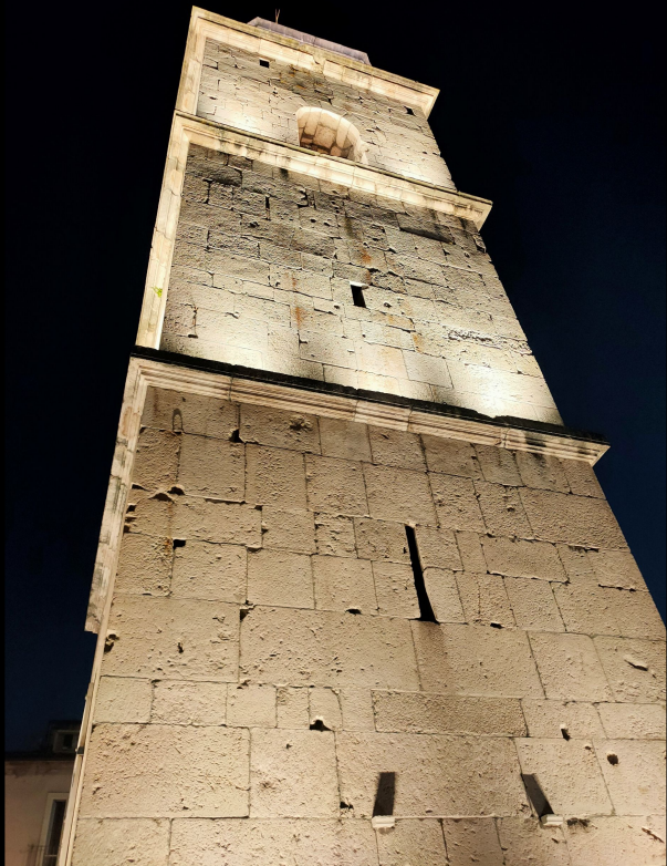
Campanile della chiesa di Santa Sofia