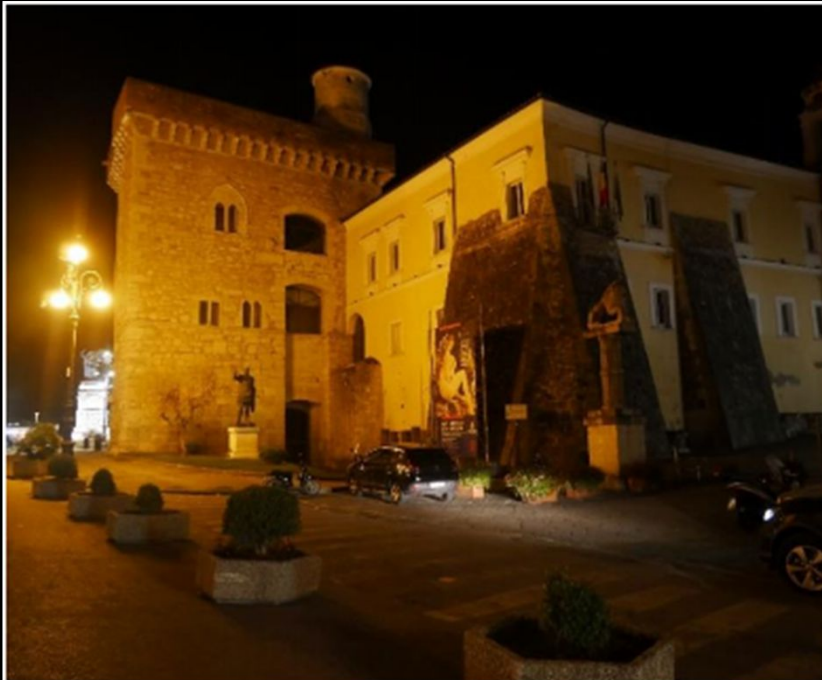
Rocca dei rettori