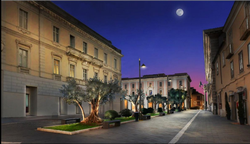
Rendering con attuale vegetazione (ulivi)