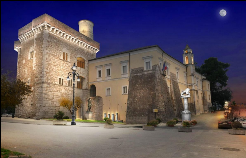
Rocca dei rettori